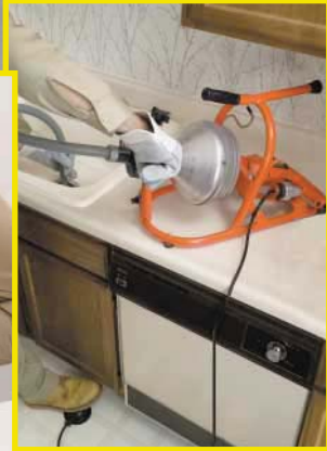
Die Wellendrehzahl kann stufenlos über den Fußschalter reguliert werden.