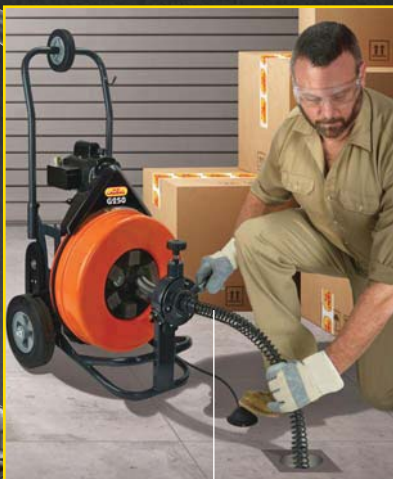
60cm lange Wellenführungs- feder

Auf Wunsch auch mit T-Nut-Kupplung lieferbar!*