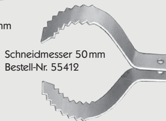
Schneidmesser 50 mm Bestell-Nr. 55412